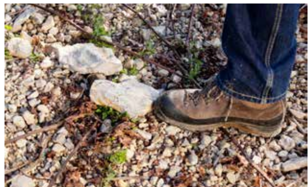
Alle Rebstöcke unserer klassischen Lagenweine wachsen auf Wellenkalkterroir.