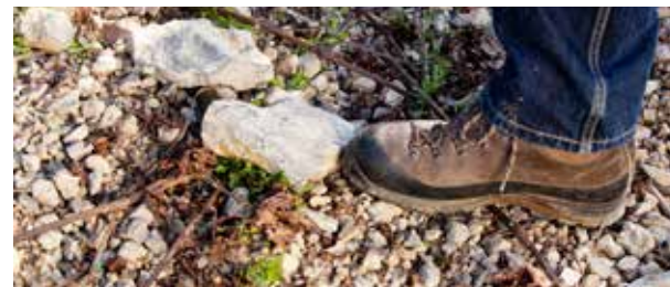
Alle Rebstöcke unserer klassischen Lagenweine wachsen auf Wellenkalkterroir.

2018 Homburger Edelfrau 10,80 €/l 0,75 l 8,10 € Riesling Kabinett feinherb Aroma von Wiesenkräutern, weiße Johannisbeere, harmonische Säure RZ: 5,5 g/l, GS: 6,6 g/l, A: 11,5 %vol